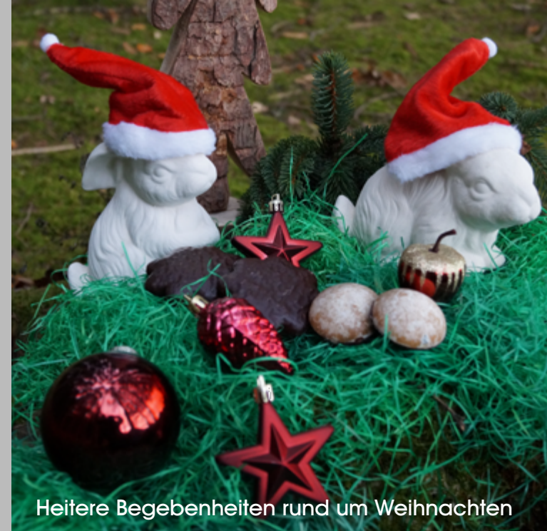
Heitere Begebenheiten rund um Weihnachten

Getränkemarkt Zäch 83134 Prutting, Edlinger Straße 8 Tel.: 08036/7208-Fax: 08036/9088998 Öffnungszeiten: Mo – Fr 8.30 – 12.00 u. 15.00 – 18.00 Uhr Sa 8.00 – 12.00 Uhr Mittwoch Nachmittag geschlossen